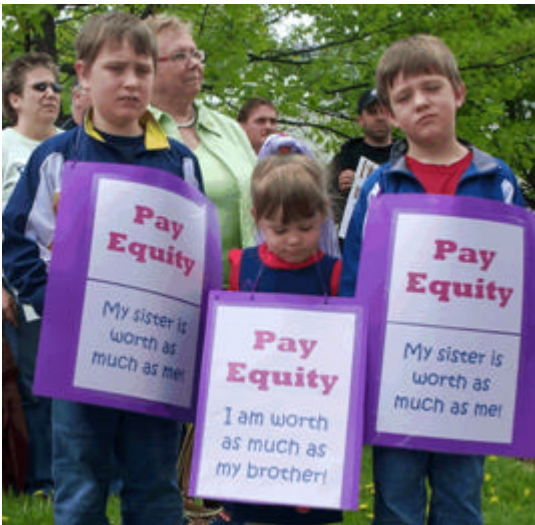
l'Opposition officielle, Shawn Graham.

Une centaine de manifestants se sont rassemblés le 25 mai 2006 à l'Assemblée législative pour demander une loi sur l'équité salariale lors du ralliement organisé conjointement par la Fédération des travailleurs et travailleuses